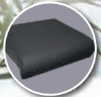
Coussin Classe II