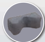
Cale tête fabrication spéciale