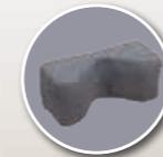
Cale tête fabrication spéciale