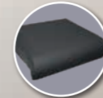
Coussin Classe II