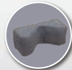
Cale tête fabrication spéciale