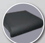
Coussin Classe II