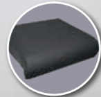
Coussin Classe II