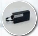
Kit batterie Evasion e II