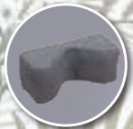
Cale tête fabrication spéciale