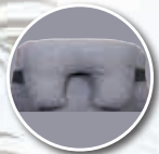
Appareil de soutien partiel de la tête