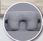
Appareil de soutien partiel de la tête