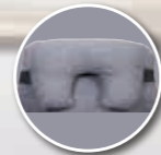
Appareil de soutien partiel de la tête