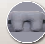
Appareil de soutien partiel de la tête